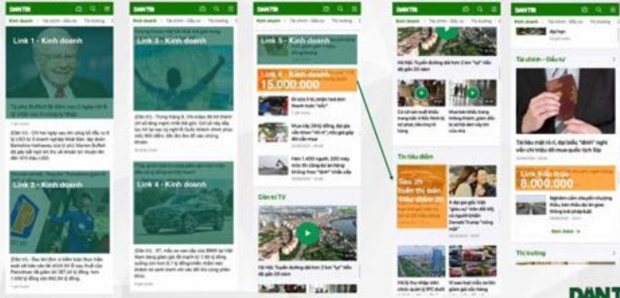
Link bài chuyên mục nhóm 1