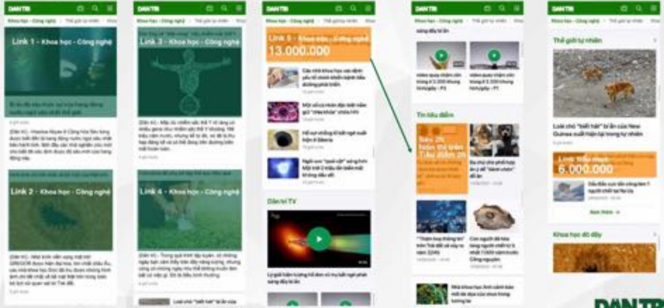
Link bài chuyên mục nhóm 2